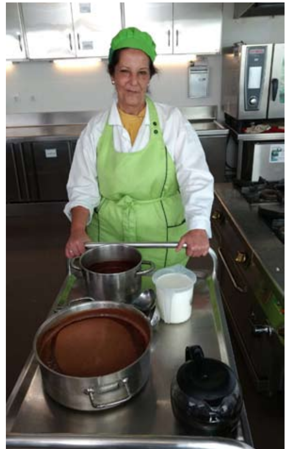
Mar delante del chocolate, el té y el café que prepararon durante el curso.

Por ejemplo si son pimientos rellenos en salsa, ellas hacen todo. Si preparamos una merluza en salsa verde, les traigo la merluza